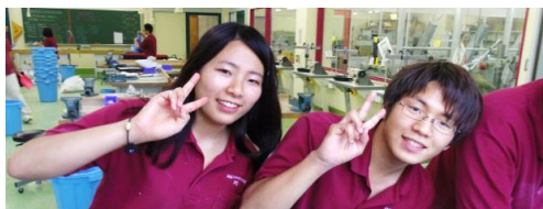
試験が無事終了？し、ほっとした笑顔の1年生↓

『大変だったけど楽しかった!』と例年の先輩たちよりも頼もしい言葉の1年生。まだ余裕あるの!と驚きました。